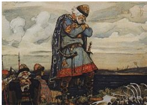
Олег біля кісток коня. Ілюстрація до «Піснь про віщого Олега» О. С. Пушкіна.

Повість временних літ відносить смерть Олега до 912, вказуючи на його могилу на Щекавиці. Там же наведено і відому версію про смерть князя від укусу змії. За Новгородським Першим літописом Олег помер 922 від укусу змії, але в околицях Ладоги, де і був похований.