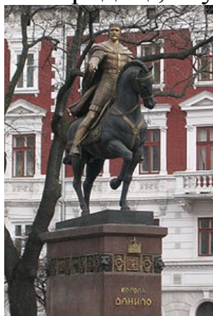
Пам'ятник королю Данилові у Львові

1264 — Данило Галицький занедужав і помер у Холмі, де й похований у церкві святої Богородиці, яку сам і збудував.