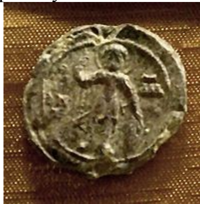
Печатка Давида Ігоровича

Рештки князівського поховання, знайдені у 1937–1938 при розкопках заснованого ним Давид-Городка, імовірно могли належати Давидові Ігоровичу.