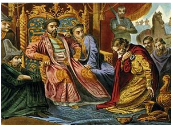
Олександр І Невський на колінах перед Великим ханом Батием. Хромолітографія. Кінець XIX ст.

Олександр Невський Канонізований Російською православною церквою до лику благовірних при митрополиті Макарії на Московському Соборі 1547 року.