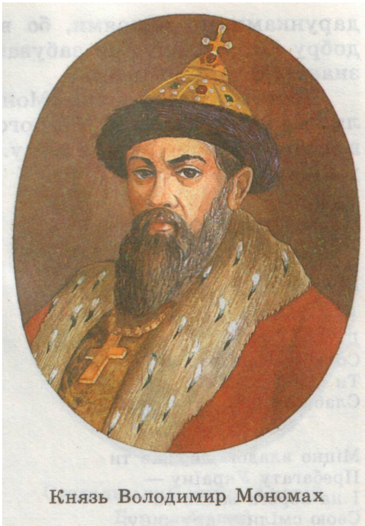
Князь Володимир Мономах