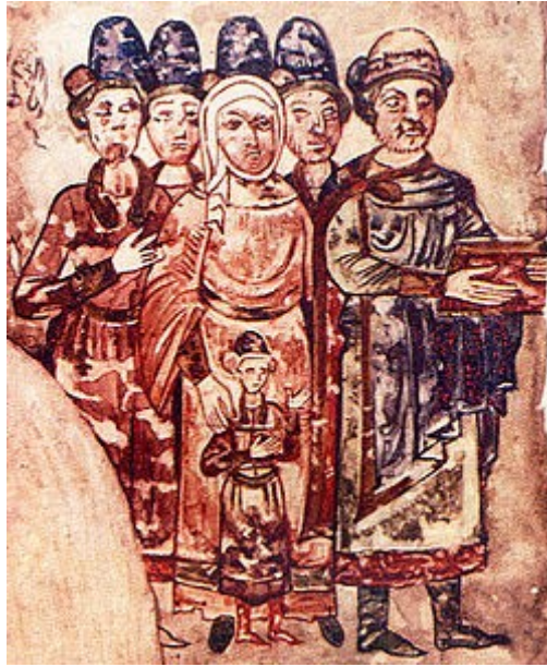
Святослав Ярославич з родиною. Зображення з «Ізборника Святослава» від 1073 року

Святослав II Ярославович (у хрещенні Микола , *1027 — †27 грудня 1076) — князь чернігівський (1054–1073), київський (22 березня 1073—27 грудня 1076), син Ярослава I Мудрого.