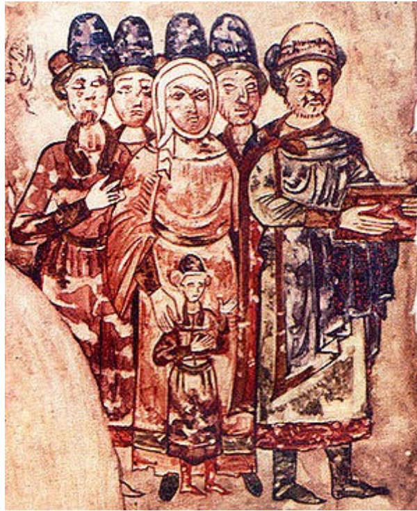
Святослав Ярославич з сім'єю, один з синів — Давид Святославич

Давид Святославич (*1050 — †1 серпня 1123) — князь переяславський (1073–1076), князь муромський (1076–1093), князь смоленський в (1093–1095 і 1096–1097), князь новгородський в (1094–1095), князь чернігівський (1097–1123). Середній з п'яти синів великого князя київського Святослава II. Внук Ярослава I Мудрого.