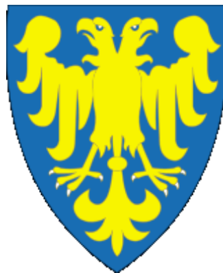
Герб Романа Мстиславича

Роман загинув 19 червня 1205 року у битві під Завихостом. Був тимчасово похований у руській церкві святого Якова на передмісті Сандомира. Після його смерті Галицько-Волинське князівство до 1238 року припинило своє існування як єдина держава.