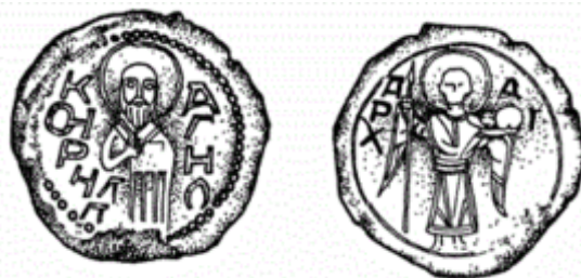
Печатка Святослава III Всеволодовича

Втім Ростиславичі не залишилися в накладі: за угодою із Святославом вони взяли собі південну «Руську землю», тобто фактично Київщину. У 1181–1194 роках у Південній Русі правив дуумвірат голів кланів Ольговичів і Ростиславичів. Це якоюсь мірою послабило між князівські усобиці. В 1183–1194 Святослав як великий князь київський очолював походи південноруських князів проти половців, але непослідовність його політики стосовно кочовиків і намагання ухилитися від боротьби з ними призвели до активізації половецьких нападів на Русь з 1180-х років. Помер у Києві.