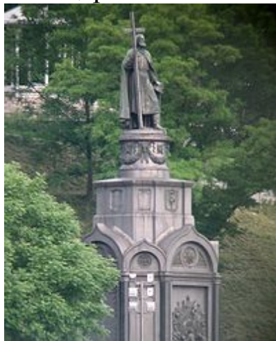
Пам'ятник Володимиру Великому (Київ)

985-го року Володимир Святославич виступив проти Волзької Булгарії. Головним результатом Херсонеської війни (осінь 987-го — весна 988-го років) було не тільки прийняття християнства на Русі (988), але й союз з Візантією, скріплений шлюбом із принцесою Анною, дочкою імператора Романа II (938–963). Володимир Святославич першим з київських князів став карбувати власні монети. Володимир-Василь Святославич помер 15 липня 1015-го року у своїй приміській резиденції Берестові. Останки Володимира були вночі таємно перевезені до Києва і захоронені в мармуровому саркофазі у збудованій ним Десятинній церкві.